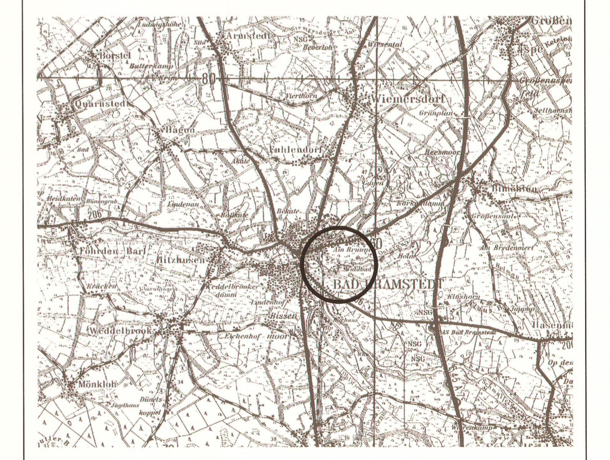
ÜBERSICHTSKARTE M. 1:100000