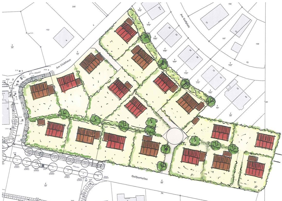
Abbildung 1: Städtebauliches Funktionskonzept für den Geltungsbereich der 7. Änderung des Bebauungsplanes Nr. 36 (Stand 11/2017).

Zudem werden im Rahmen der 7. vereinfachten Änderungen Anpassungen an den Bestand vorgenommen. Diese betreffen die bisher in der 3. Änderung des Bebauungsplans festgesetzte private Grünfläche mit Anpflanzstreifen, die nicht dem Bestand entspricht.