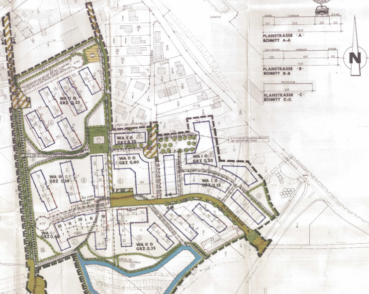
B-PLAN NR. 55