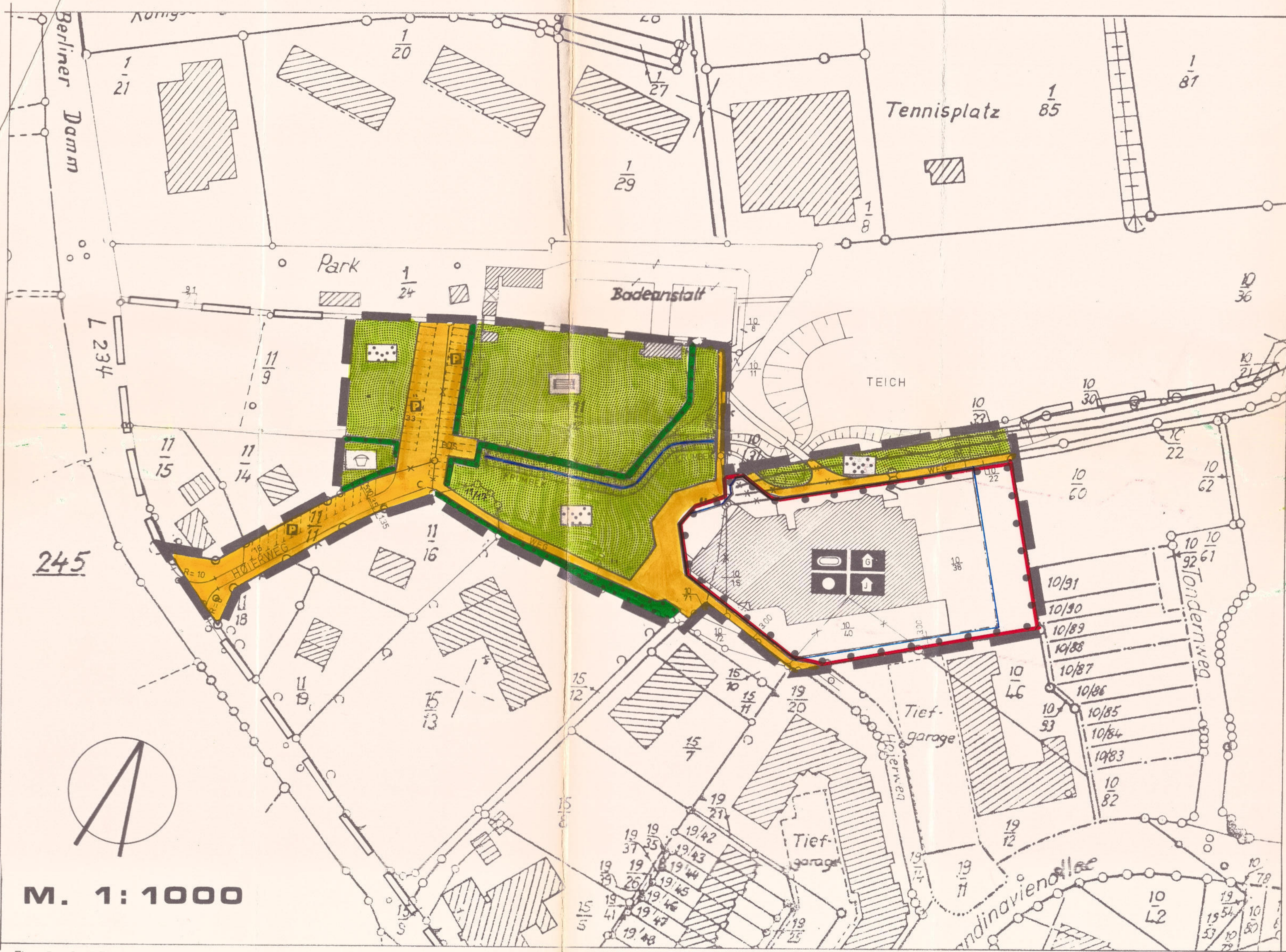
Flur 5 Gem. Ellerau