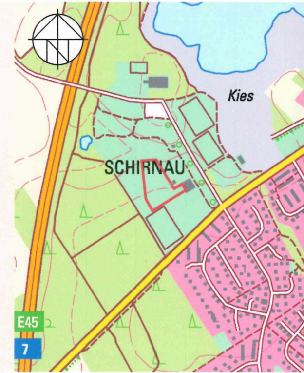
Übersichtsplan 1 : 12.500