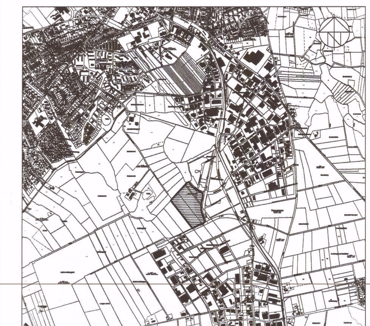
Übersichtspan 1 : 25.000

Aufgrund des § 10 des Baugesetzbuches (BauGB) sowie nach § 84 der Landesbauordnung (LBO) wird nach Beschlussfassung durch die Stadtvertretung vom 23.06.2009 folgende Satzung über den Bebauungsplan Nr. 61: 5. Änderung "Westerwohld Nord", für den Bereich: südlich der Grashofstrasse und westlich der Hamburger Strasse (L 320), bestehend aus der Planzeichnung (Teil A) und dem Text (Teil B), erlassen.