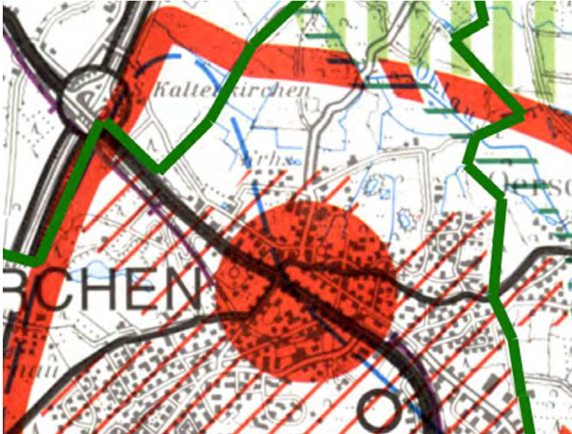
Abbildung 1: Ausschnitt Regionalplan 1998 für den Planungsraum I (Stadtgrenze hervorgehoben)

Die zentralen Orte einschließlich der Stadtrandkerne sind Schwerpunkte der Siedlungsentwicklung. Sie sollen dieser Zielsetzung durch eine vorausschauende Bodenvorratspolitik und durch eine der zukünftigen Entwicklung angepasste Ausweisung von Wohnungs-, Gemeinbedarfs- und gewerblichen Bauflächen gerecht werden (Ziel der Raumordnung gem. Ziffer 5.1 (7)).