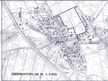
ÜBERSICHTSPLAN M. 1:5000