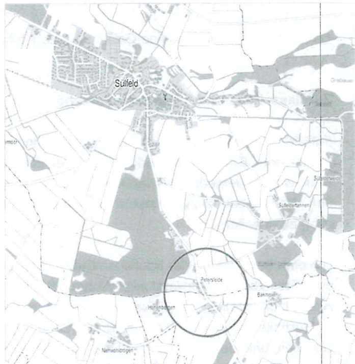
Abb. 1: Lage des Satzungsgebietes

Die Gemeinde Süfeld kann im Rahmen ihrer Planungs-