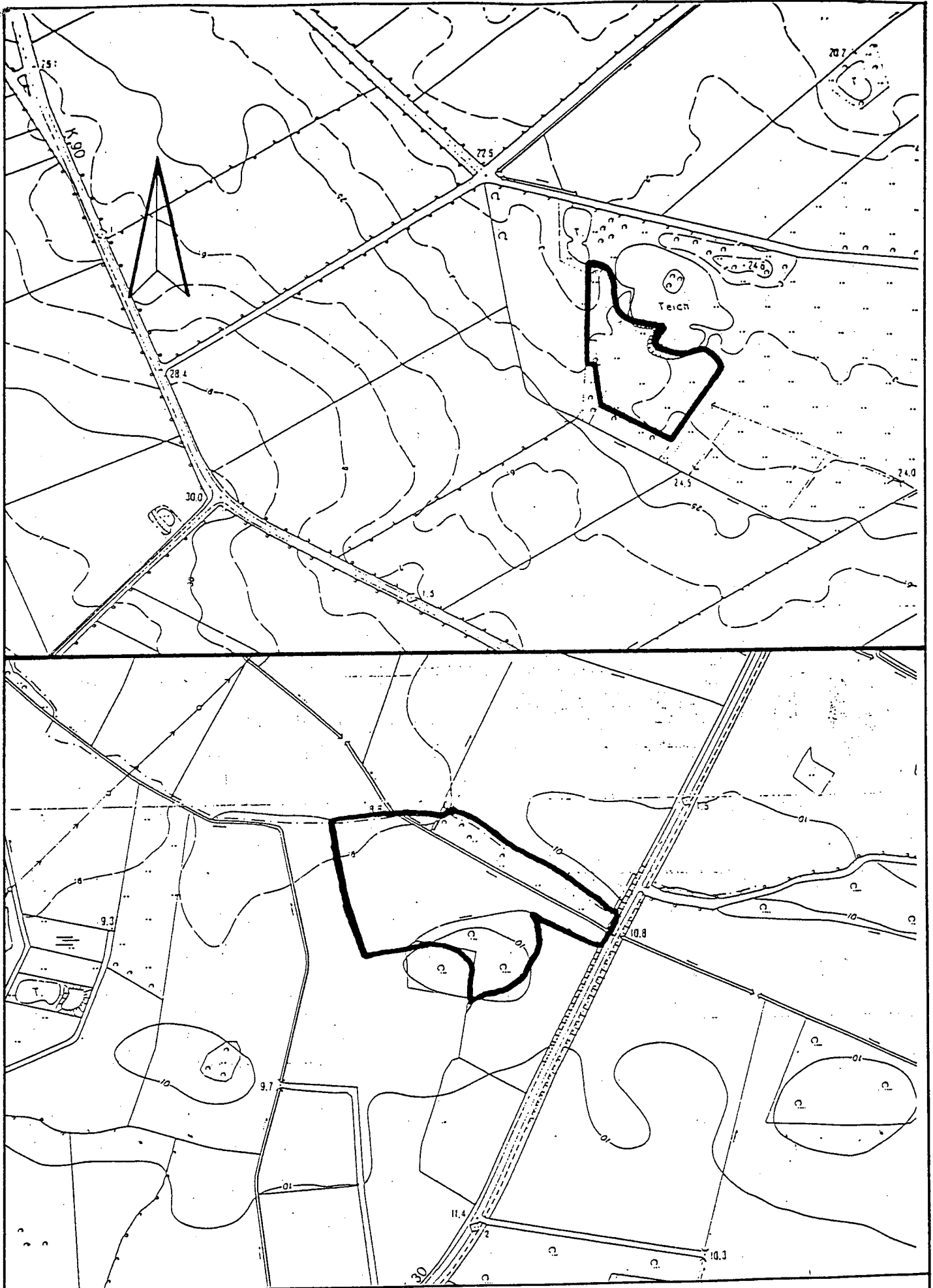
ÜBERSICHTSPLAN ERSATZFLÄCHEN M 1:5000