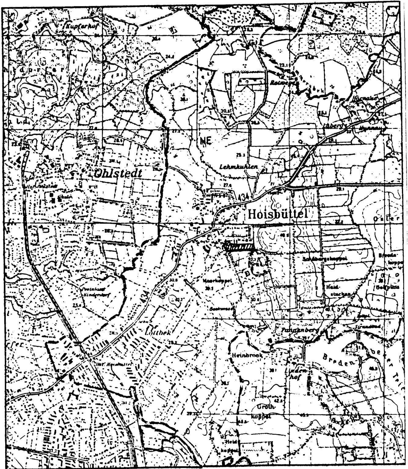
ÜBERSICHTSPLAN M 1:25.000

Zum Bebauungsplan Nr. B6, "Am Schüberg", 2. Änderung im Orts- teil Hoisbüttel, für das Gebiet nördlich des Schübergredders.