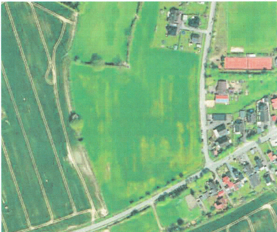
Abb.: Digitaler Atlas Nord

Westlich grenzen intensiv landwirtschaftlich genutzte Flächen an das Plangebiet an. Nördlich des Plangebietes auf der Westseite der Straße Mitteltor und östlich der Straße Mitteltor befindet sich die bebaute Ortslage Badendorfs. Nordöstlich befinden sich Sportanlagen.